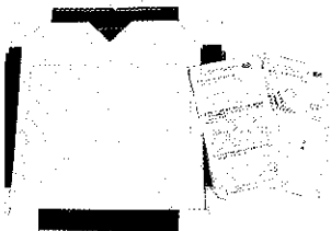
灯ろう組み立てキット